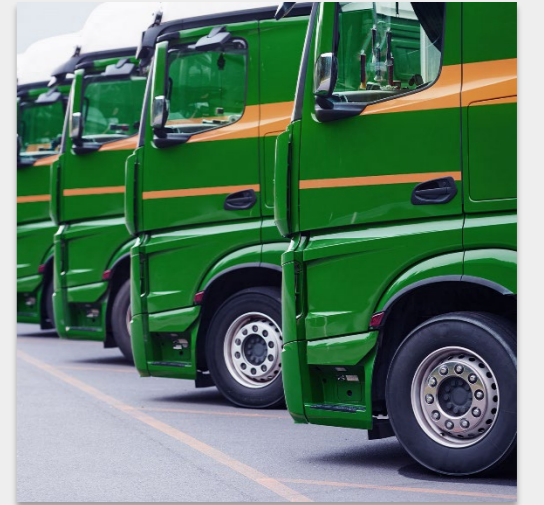
Flottenmanagement und Nutzfahrzeuge